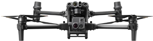
DJI Matrice 30T