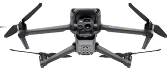
DJI Mavic 3 Thermal